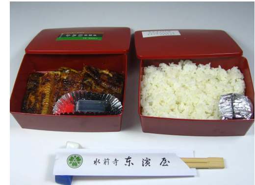
③上うな重弁当 上蒲焼一尾仕様 3,600円+税