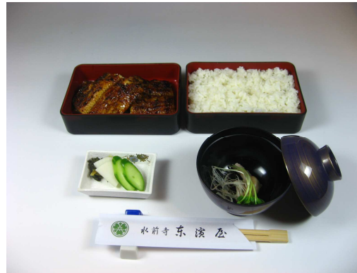
①上うな重 上蒲焼一尾仕様 3,800円+税