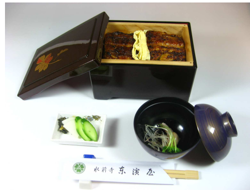
②上セイロ蒸し 上蒲焼大3切れ仕様 3,800円+税