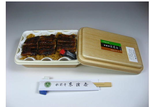
④持帰り上セイロ弁当 上蒲焼3切れ仕様 3,600円+税